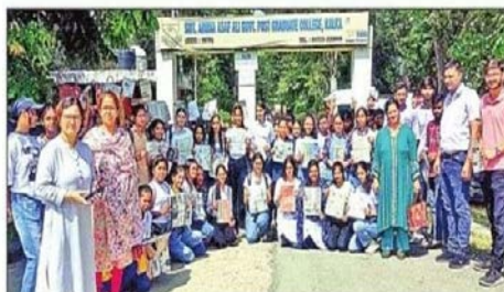
कालका के राजकीय महाविद्यालय में स्वच्छता का संदेश देने विद्यार्थी और स्टाफ।