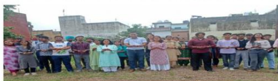
हरियाणा सन्ध्या टाइम्स, कालका।

राष्ट्रीय सेवा योजना के स्वयं सेवकों ने मेरी माटी मेरा देश अभियान के अंतर्गत विभिन्न गतिविधियों में भाग लिया।