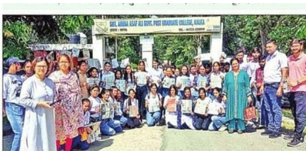
कालका के राजकीय महाविद्यालय में स्वच्छता का संदेश देते विद्यार्थी और स्टाफ। संवाद

Description: One day Swachhta camp was organized in the college campus and surrounding areas such as bus stand and outside college campus in which so students participated enthusiastically. They cleaned the area and also spread awareness to the public to keep their surrounding clean.